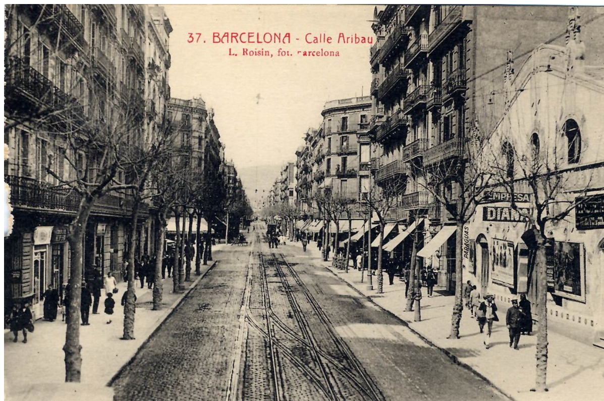
Calle en la que se sitúa la acción de Nada de Carmen Laforet

Barcelona fue una ciudad afluyente y cosmopolita antes de la Guerra Civil.